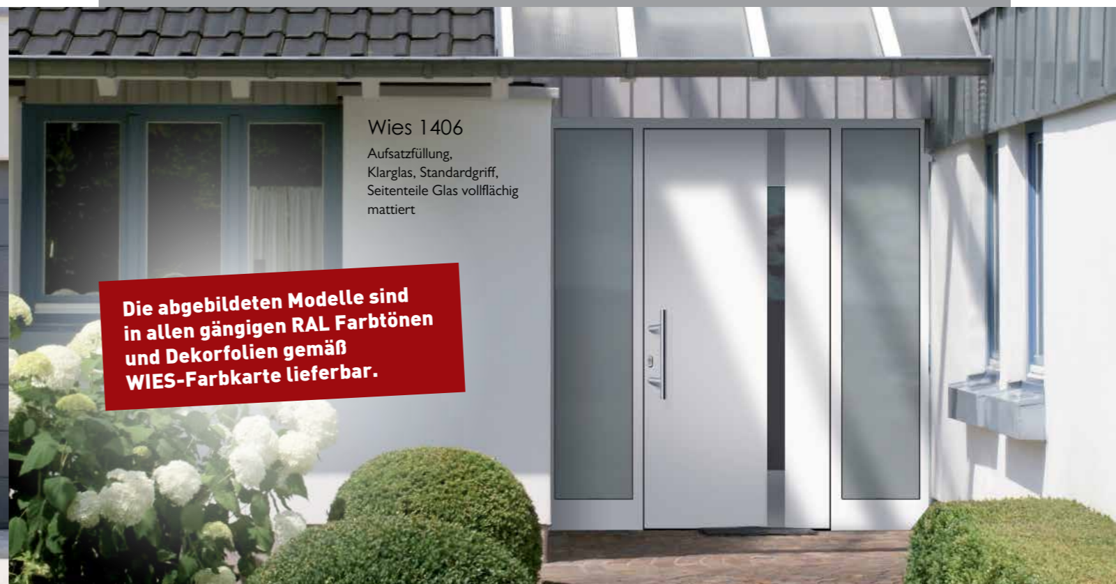
Wies 1406 Aufsatzfüllung, Klarglas, Standardgriff, Seitenteile Glas vollflächig mattiert

Die abgebildeten Modelle sind in allen gängigen RAL Farbtönen und Dekorfolien gemäß WIES-Farbkarte lieferbar.