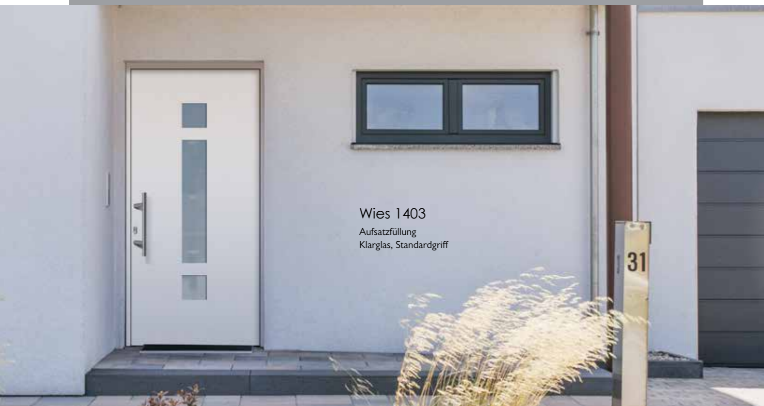
Wies 1403 Aufsatzfüllung Klarglas, Standardgriff

Einsatzfüllung, Glas Parsol grau, Standardgriff